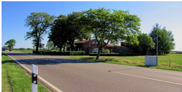
Dauerzählstelle an einer Bundesstraße