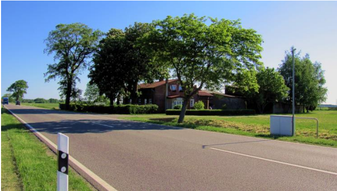
Dauerzählstelle 18391716 an der Bundesstraße B105